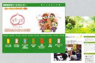
高齢者福祉施設(NPO法人ももの会)