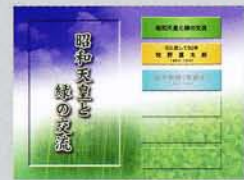
タッチパネル映像 昭和天皇と緑の交流