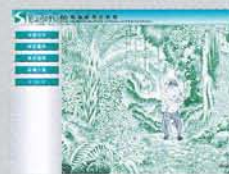
しょうけい館 (戦傷病者史料館)