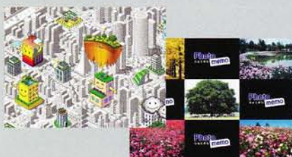
花みどり文化センター展示映像 (国営昭和記念公園)