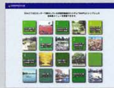
情報検索システム (花みどり文化センター)