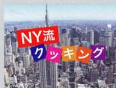
DVDミニ番組 NY流クッキング