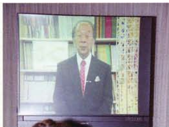
菊竹清訓審査委員長、紹介映像

<映像メディア制作・会場構成> オープニングムービー、DVD映像、展示パネル、pptデータ等