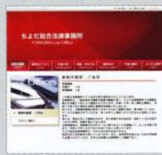
某法律事務所 ホームページ