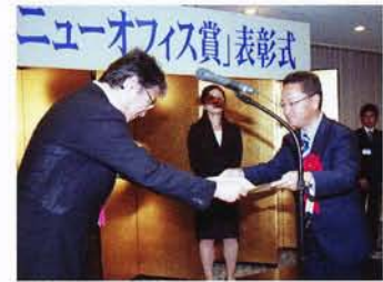
日経ニューオフィス賞 表彰式