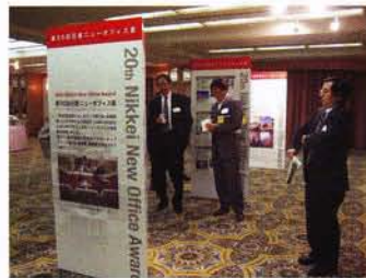
20周年記念展示パネル